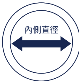
圓形為美國戒指尺寸及直徑。