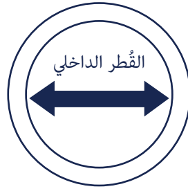
الدوائر الخاصة بحجم الخاتم وأقطار الخواتم في الولايات المتحدة.

3. إذا كان مقياس الخاتم يندرج بين حجمين، فاطلب الحجم الأكبر.